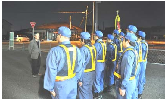
消防団員に激励を行う連区町会長代表者

千秋北分団と南分団は30日に一宮市副市長、一宮警察署副署長が激励に訪れ、その機会に合わせて地元市議会議員と町会長からの激励も行われた。