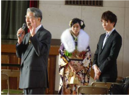
【学校運営協議会からの激励】

新たに成人となる方は、もう既に平成生まればかりとなつていますが、今年の新成人は、平成7年4月から翌年3月(曆上4月1日まで)生まれの皆さん。選ばれた実行委員の方々が中心となってイベントをこなしていました。運営を任された皆さんには大変ご苦労様でした。朝早くからお疲れ様でした。