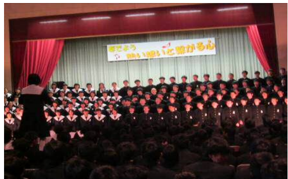
【3年生による学年合唱】