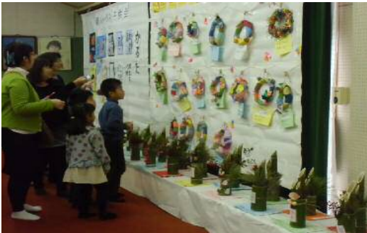
【子ども会力作の数々】

見事としか言いようの無い寄植えを始め、書道・絵画・海外や紅葉の写真・手芸や子どもたちの頑張った作品などが並べられ、来場者の目を楽ませました。