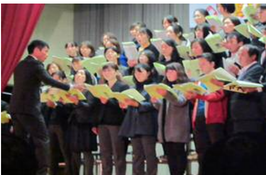
【先生とおやじの会による合唱】