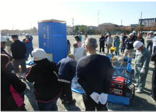
(←避難所資器材の説明)