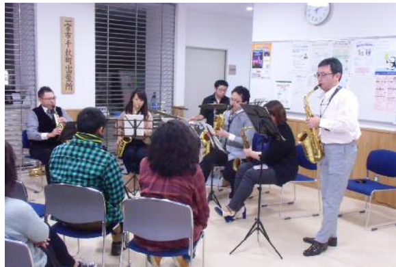
(←ミニコンサート風景)