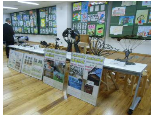
(←秀逸作品群に感無量!)

作品の内容は、書道・ 絵画・写真・手芸・刺繍・ 鉢植・和装など多種にわたり、いずれも力作がずらりと並べられました。 また、サプライズ演出として、サクセス&ドラムのミニコンサートも行われました。