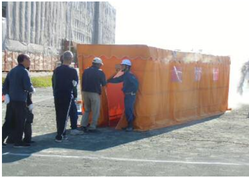
(←スモークハウス煙体験)

早朝より千秋中学校運動場に全町内から260名を超える参加者が参集し、一宮消防署千秋出張所職員及び千秋南北消防団員の皆さんの指導を受けながら初期消火訓練など様々な訓練を通して地域防災・災害に対する備えを学びました。