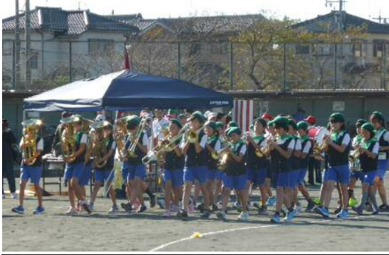
(←金管バンドで入場行進)

昨年から天候に悩まされてきましたが、今年は無事青空の下で開催することができました。若いも若きも一生懸命競技に取り組む姿に観客席からは大きな拍手が送られました。ある町内では事前に特訓をしているとか？