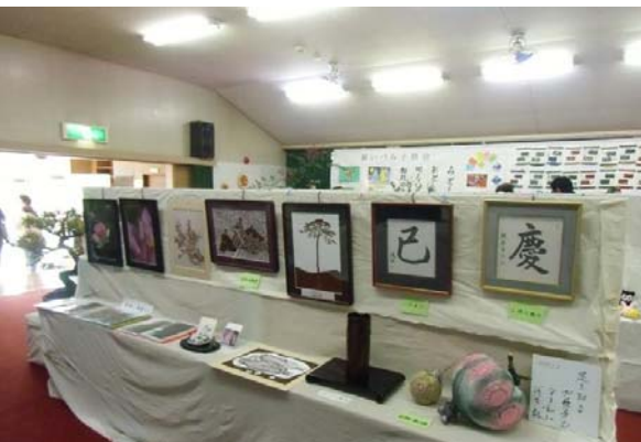
(写真は展示された一部)

毎年の正月早々に開催されており、町内の子どもたちが制作した作品を含め多数の作品が寄せられているが、絵画・書・写真・立華・生花・手芸などいずれも力作がそろい、来場者の目を楽しませた。