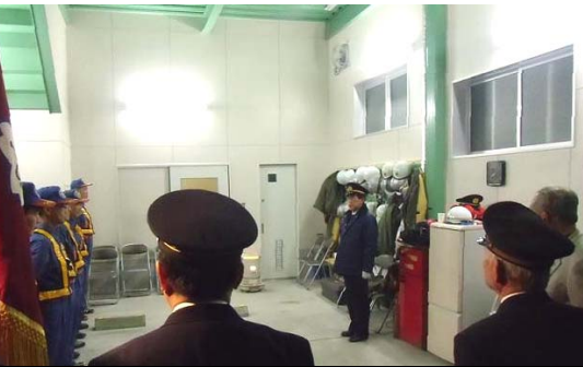
(写真は千秋北分団)

12月29日(土)夜、「消防団年末特別警戒」に合わせ、市内に結成されている各分団のそれぞれの車庫において、消防団員に対し、激励が行われた。千秋北分団及び南分団に対しても同日一宮市長が激励に訪れ、各団員へ労いの言葉が掛けられた。同時に地元市議会議員及び町会長会からの激励も行われた。