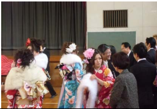
(対象者151名中93名の参加者で賑う新成人と恩師)

この日成人を迎える同級生が母校である千秋中学校に参集し、恩師とともに思い出を語り、旧交を温めると共に成人の誓いを新たにする場にしようとする目的で始められ今に至っています。既に新成人も平成生まればかりとなり、隔世の感が強くなった方も多いかとは思われますが、次世代を担う新しい力を発揮されるよう期待します。