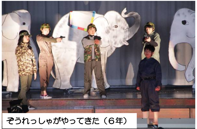
ぞうれっしゃがやってきた(6年)