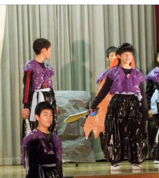
6年「アリババと40人の盗賊」

「さんびきのやぎのがらがらどん(1年生)」「スイミー(2年生)」「化かしっこな〜し(3年生)」「クサイリルを探せ(4年生)」「100万回生きたねこ(5年生)」「ぞうれっしゃがやってきた(6年生)」を劇や合唱で発表しました。