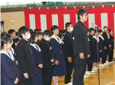
※学校紹介は次号に続きます。

「ダンス」も見ものです。 『音楽会』は12月16日(土)に行います。昨年度は、合唱コンクールはもちろんのこと、職員とおやじの会との「決意」「君をのせて」の合唱で会を盛り上げました。保護者の方はもちろんのこと、地域の方の観覧も大歓迎ですので、ぜひ生徒の活躍をご覧いただけると幸いです。 『名門千秋中学校』がますます輝き、発展していきますよう、今後も地域の皆様のご支援をよろしく願います。 【一始業式の一場面】