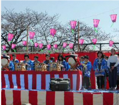
【馬場草笛太鼓打囃子】

しかし、特設ステージでは「馬場草笛太鼓打囃子」「大正琴」「民謡ショー」「沖縄工イサー」「ジャズ演奏」。また、今年の子供を対象に「お菓子のつかみ取り」「スーパードールすくい」が行われるなど盛りだくさんで、会場内は大勢の参加者で賑わっていました。