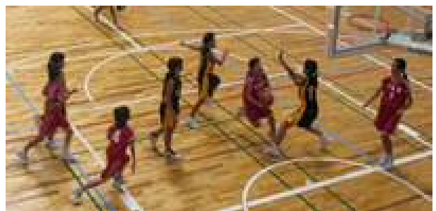
千 秋 東 小 ミ ニ バ ス

女子の初戦は、第三クォーターまでは、チームディフェンスやオフセンスも練習どおりに進めることができました。しかし、最終の第四クォーターの終了のブザーと同時に同点シュートを決められ、延長戦で負けてしまいました。子どもたちはチームワークを大切に、最後まで持てる力を出し切りました。