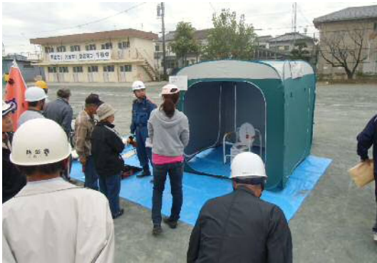
(←避難所資器材の説明)