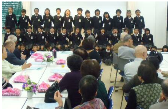
【一宮東幼稚園遊戯披露】