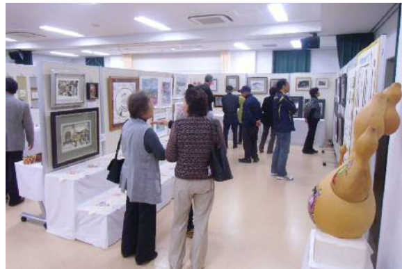
(←いずれも秀逸に感動!)