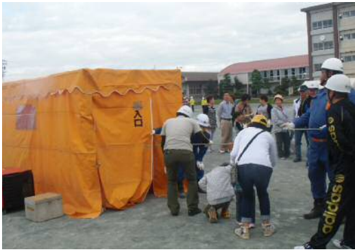
(←スモークハウス煙体験)

早朝より千秋中学校運動場に全町内から300名を超える参加者が参集し、一宮消防署千秋出張所職員及び千秋南北消防団員の皆さんの指導を受けながら初期消火訓練など様々な訓練を通して地域防災・災害に対する備えを学びました。