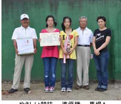
やさしい競技 準優勝 馬場A