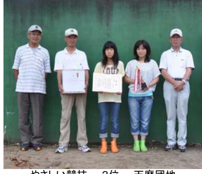
やさしい競技 3位 天摩団地