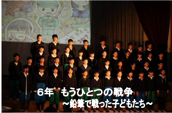
6年 もうひとつの戦争 ～鉛筆で戦った子どもたち～

ました。「わが子の成長を見ることができ、うれしく思いました。」「子どもたちが元氣よく、楽しく演技していてよかったです。」などの感想が寄せられ、学校全体で充実感を味わうことができました。これからも温かいご支援とご協力をお願いします。